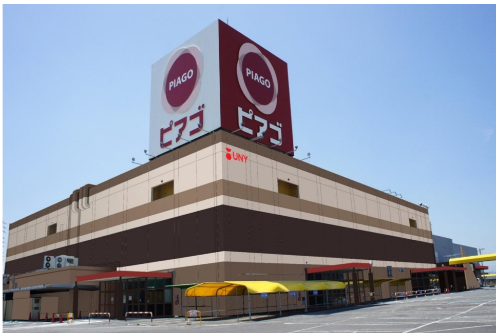
ピアゴ江南店外観イメージ

今回のリニューアルでは、「地域に愛され続ける日常生活便利店」をコンセプトに、大幅に店内改装を実施しました。直営のスーパーマーケットは売場面積を約15%拡大し、日用消耗品や家庭用品などの住居関連品を新たに品揃えするほか、シニア層のニーズに対応するため、調理が簡単な食品や、旬や鮮度、味にこだわった食品を少量から品揃えします。また、専門店舗数を約2.5倍に増やし、2階フロアの半分を使いアミューズメント施設2店舗が出店するなど、あらゆる世代のお客様に毎日のお買い物を楽しんでいただける店舗を目指してまいります。